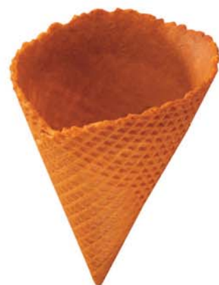
61271 Kornout Bertička 360 ks v krt