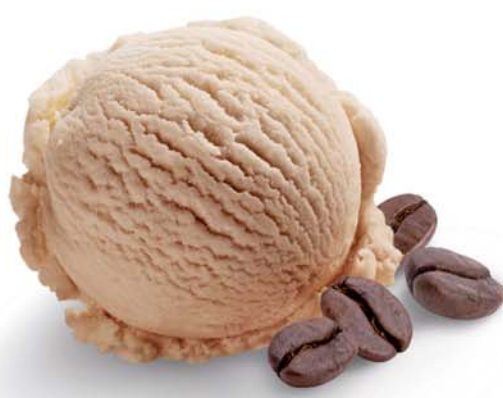
Zmrzlina s kávovou příchutí

Zmrzlina s příchutí kávy s kousičky kávové čokolády pro podtržení chuti.