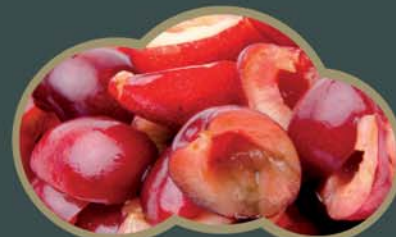
62435 Višně bez pecky 2,5 kg