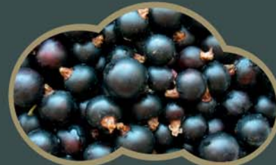
62438 Černý rybíz 2,5 kg