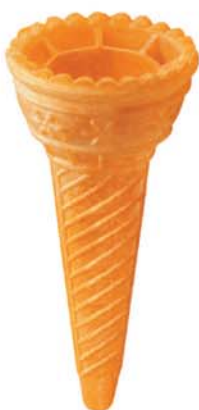
61270 Kornout Ewa 48 2 % 336 ks v krt