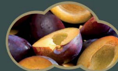
62436 Švestky pūlené 2,5 kg