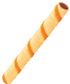
61275 Dekor. doplněk Trubička 8x140 ks v krt