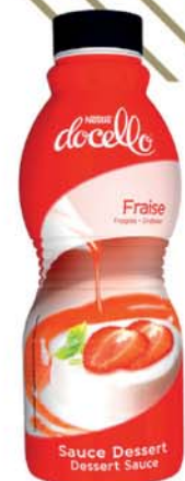
60086 Topping Nestlé jahodový 1 kg