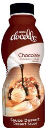
60087 Topping Nestlé čokoládový 1 kg