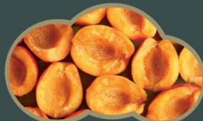
62431 Meruňky pūlené 2,5 kg