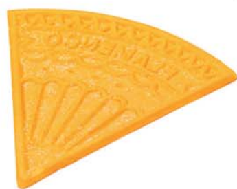
61272 Dekor. doplněk Flamengo 250 ks v krt