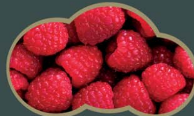
62428 Maliny celé (95% celých malin) 2,5 kg