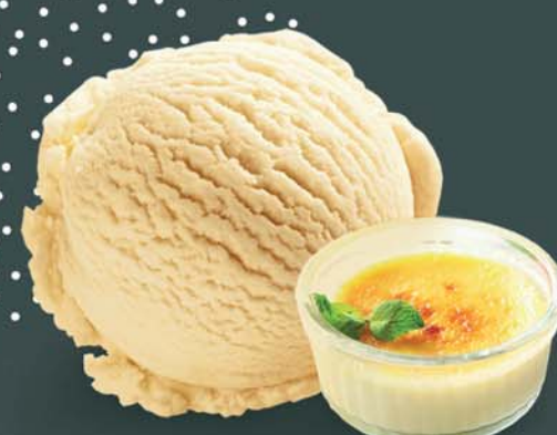
Zmrzlina s příchutí katalánského krému

Nevšedně dobrá zmrzlina s vaječnými žloutky.