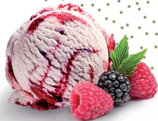
Jogurt lesní ovoce

Pro milovníky jogurtu to pravé. Jogurtová zmrzlina doladěná lesním ovocem.