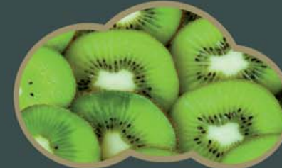
62451 Kiwi plátky 2,5 kg