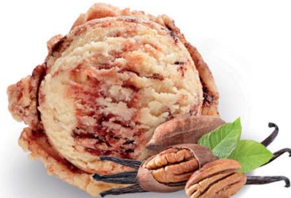
Příchutí vanilka a pekanový oříšek

Karamelizované pekanové ořechy a karamelový topping ve zmrzlině s vanilkovou příchutí.