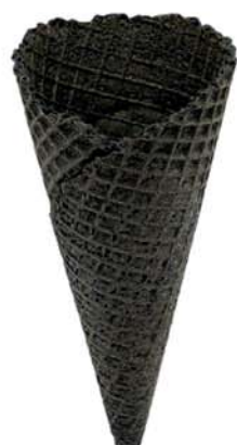
60127 Kornout Wera černý 300 ks v krt