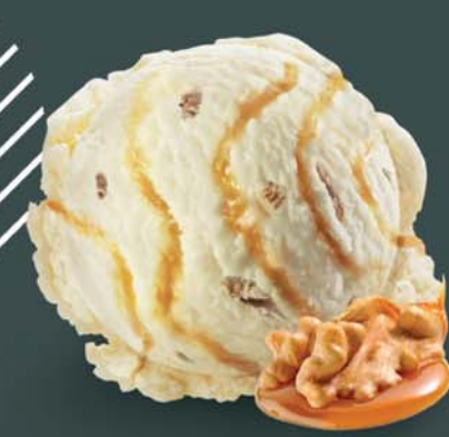
Vlašský ořech a karamel

Oříšková chuť v kombinaci se sladkým karamellem. Ideální kombinace.