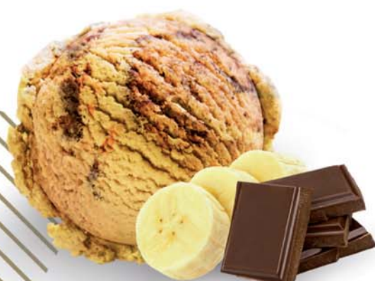
Banán s čokoládou

Skvělá kombinace banánu s čokoládou potěší každého.