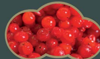
62439 Červený rybíz 2,5 kg