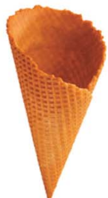
61274 Kornout Wera 300 ks v krt