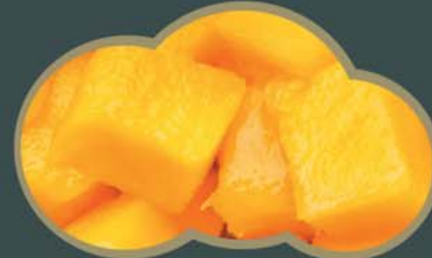
62450 Mango kostky 2,5 kg