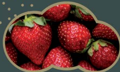
62430 Jahody celé 2,5 kg