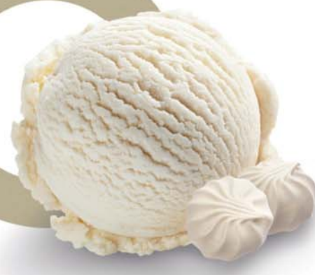
Zmrzlina s příchutí Leche Merengada

Zmrzlina s příchutí lahodného mléka a skořice.