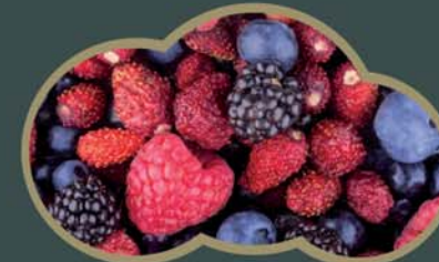
62434 Lesní směs 2,5 kg