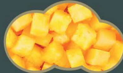
62455 Ananas kostky 2,5 kg