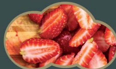
62404 Jahody krájené 2,5 kg