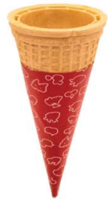
61277 Standard 560 ks v krt