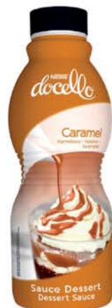
60088 Topping Nestlé karamelový 1 kg