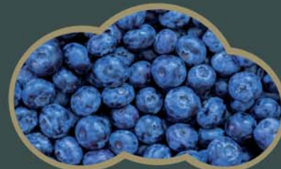
62429 Borůvky lesní 2,5 kg